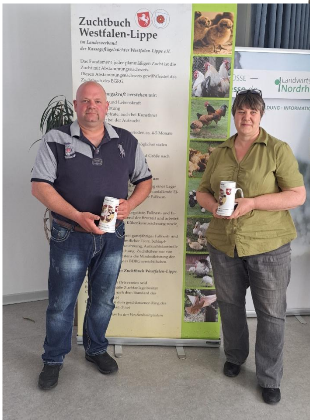
unterschiedlichen Blickwinkeln auf unser Hobby.